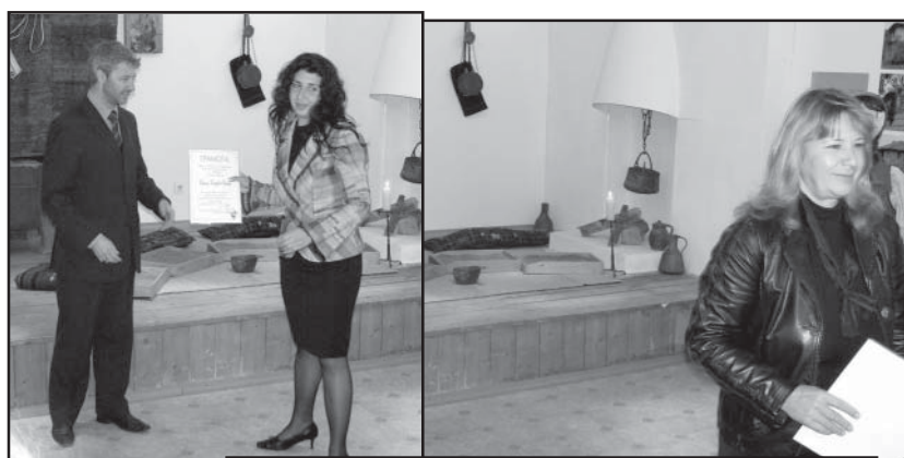
Залата в музея в Струмьяни се изпълни с хора.

Елате и вижте. В община Струмьяни историята е жива.