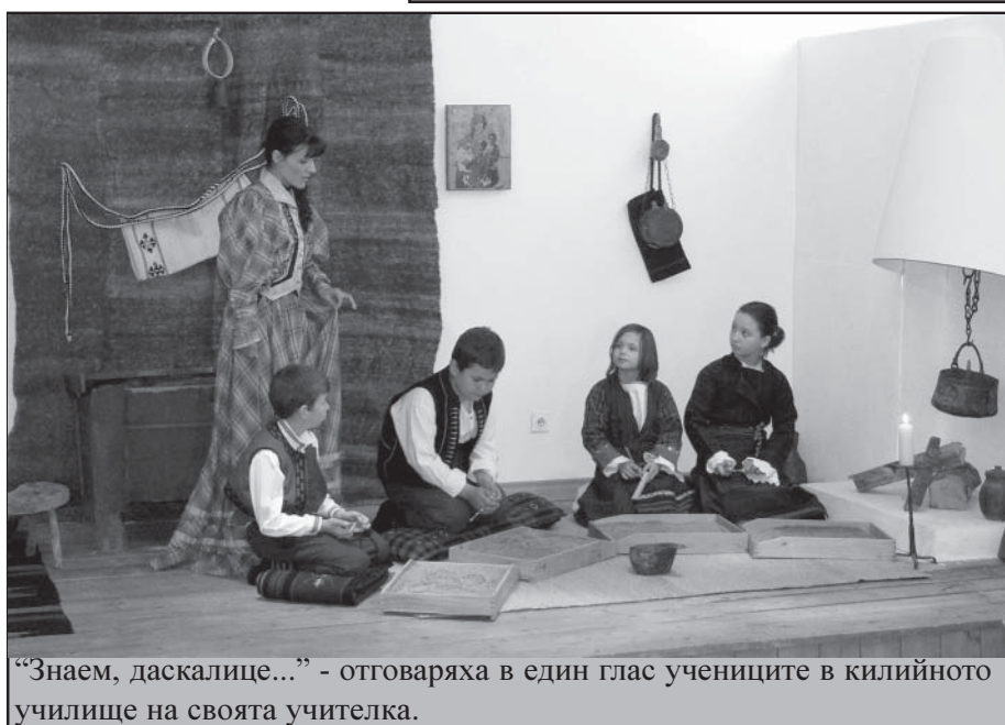
“Знаем, даскалице...” - отговаряха в един глас учениците в килийното училище на своята учителка.