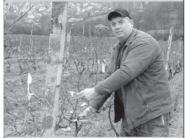
Въпреки студеното време, местни лозари и винопроизводители от община Струмяни, спазиха и тази година традицията и на 1 февруари - Св.Трифон, зарязаха лозята.