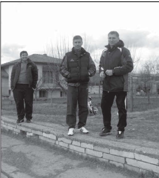
Под зорките погледи на треньорския щаб, футболистите започнаха първата си тренировка.