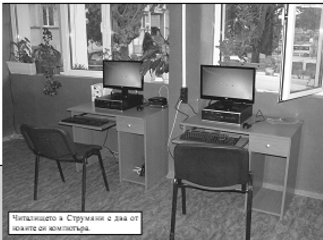
Читалицето в Струмјани е два от новите си компјутра.