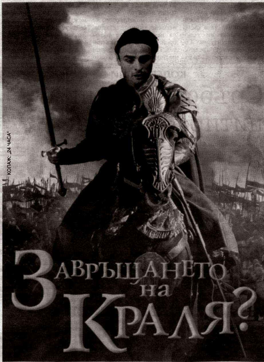
КОЛПАЖ: 24 ЧАСА

шефовете на футбола ни да вземат първия полет за Острова и ако трябва, на колене да