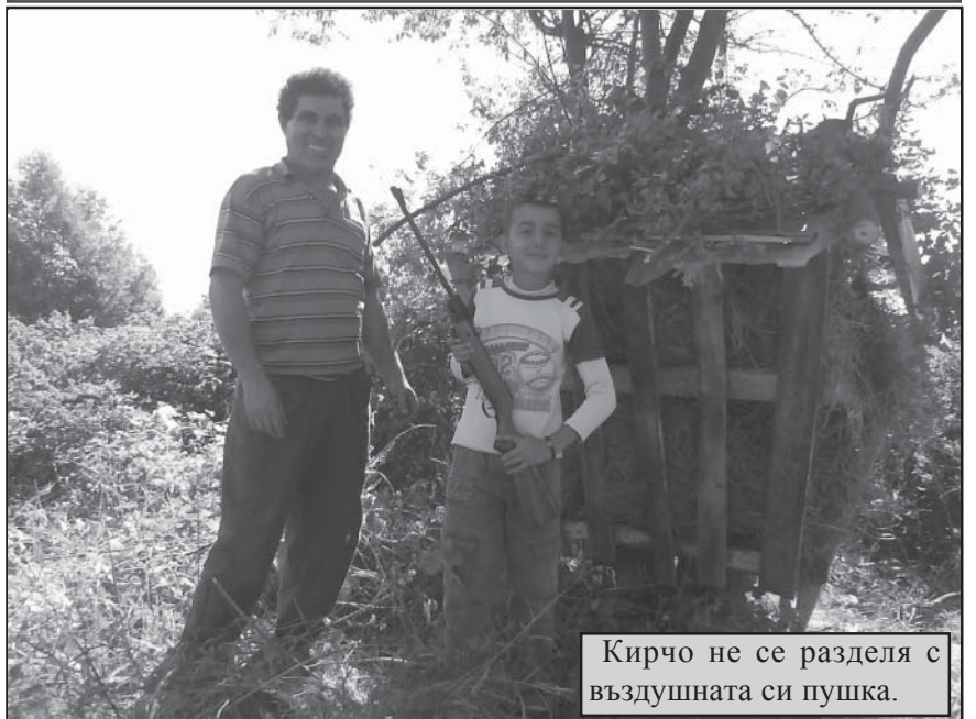
Кирчо не се разделя с въздушната си пушка.

Дни преди старта на ловния сезон ловци от няколко ловни групи от местното сдружение "Голак", дооборудваха ловните си полета с хранилки за едър и дребен дивеч. Ловците от Вракуповската ловна група избраха слънчевия съботен ден на 18 септември, за да довършат и заредят със сено, кръстените от тях самите преди време "еврохранилки".