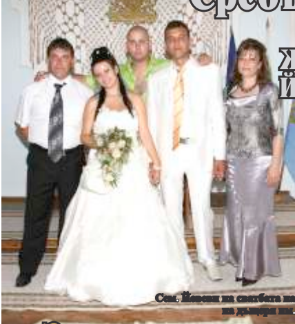
Сем. Йовевци на сватбата им на 16 години

ръка за ръка заедно 25 години и предават приказката за любовта на своите деца. Любовта, преминала през много изпитания, но жива и протрещена до слъзи в очите на двамата, имала шанса да я открият, задържат и по-сребърт.