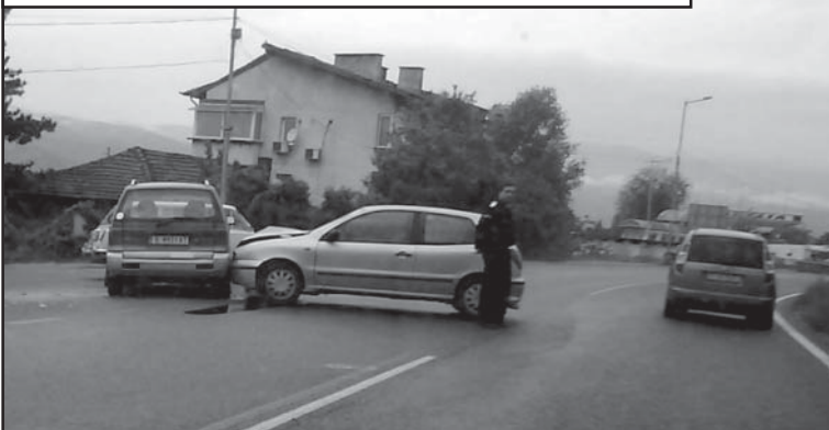
Поредната катастрофа на разклона за село Микрево на главен път Е-79 - 3 май 2011г., 08:30 часа.