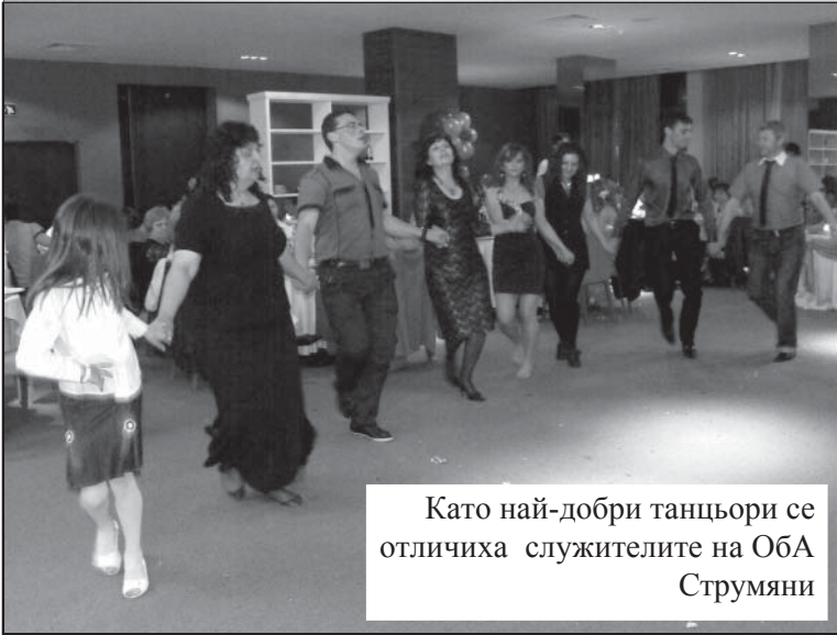
Като най-добри танцьори се отличиха служителите на ОБА Струмияни