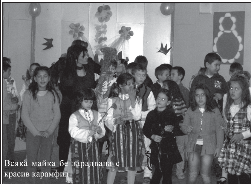
Всяка майка бе зарадвана с красив карамфил

Талантливите артисти успяха да развеселят доста жени, дошли да се посмеят с малчуганите, въплотили се в ролите на Ненка, Ненчо, Сашето и Ванката.