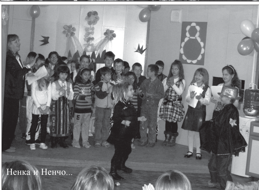
Ненка и Ненчо...