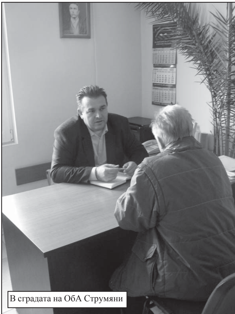
В сградата на ОБА Струмьяни