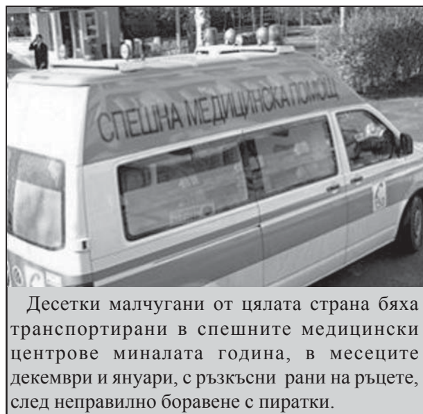
Десетки малчугани от цялата страна бяха транспортирани в спешните медицински центрове миналата година, в месеците декември и януари, с рязъксни рани на ръцете, след неправилно боравене с пиратки.

При констатирани нарушения ще бъдат наложени санкции, съгласно Наредба №1 на ОБС Струмьяни, като стоката ще бъде иззета.