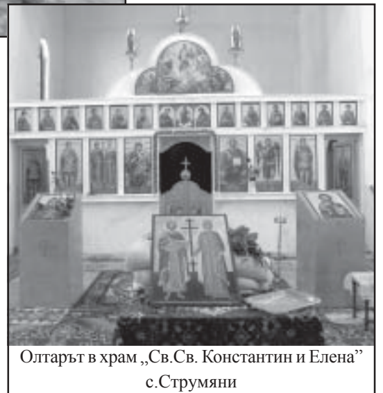
Олтарът в храм „Св.Св. Константин и Елена“ с.Струмьяни

Тази година майсторите – готвачи приготвиха два казана (300 порции) курбан от риба, тъй като празника се случва в сряда – ден, в който се пости.