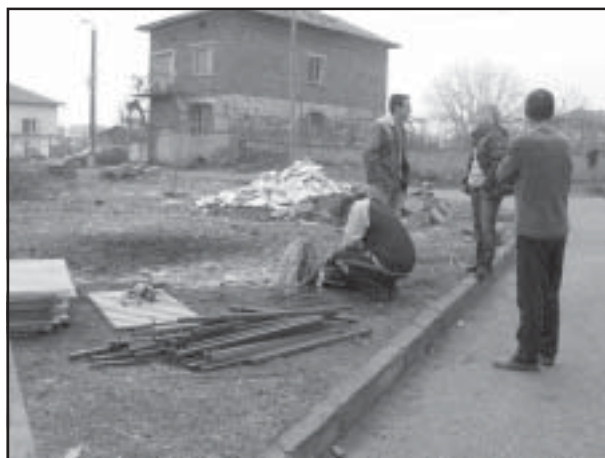
В Микрево вече има и такива улици.

Приканват се всички жители в общината (най-вече в Микрево, Струмияни, Илинденци, Драката, Каменица, Горна Крушица) да приберат съчките, дървата, купите със сено, старите строителни материали, ръждясали ремаркета и купета от леки автомобили от тротоарите и уличните платна. При извършване на ремонтни работи да извозват отпадъците си на депото в м. "Пушовец", над цеха на "Илинденци мрамор". При желание за съдействие за извозване на отпадъка от ОБА, да подадат молба в деловодството.