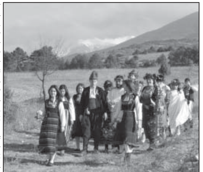
Боговете слизат на земята, за да покажат как се честват Розалиите, Дионисиите, Вакханалиите или както се знае - Трифон Зарезан.

- Не знам защо синдикатите го казват сега, а по време на стачните преговори се чуваше друго. И просветното министерство не чу тогава нашите предупреждения. В момента обучаваме нашите хора да изпълнят закона за делегираните бюджети. Лошото е, че тези които написаха текстовете в него, които са толкова трудноизпълними, сега се упражняват на наш гръб. Ще има училища, които няма да издържат. Не можем да скрием, че част от тях не са ефективни като качество на обучението. Но не само това е проблемът. Създали