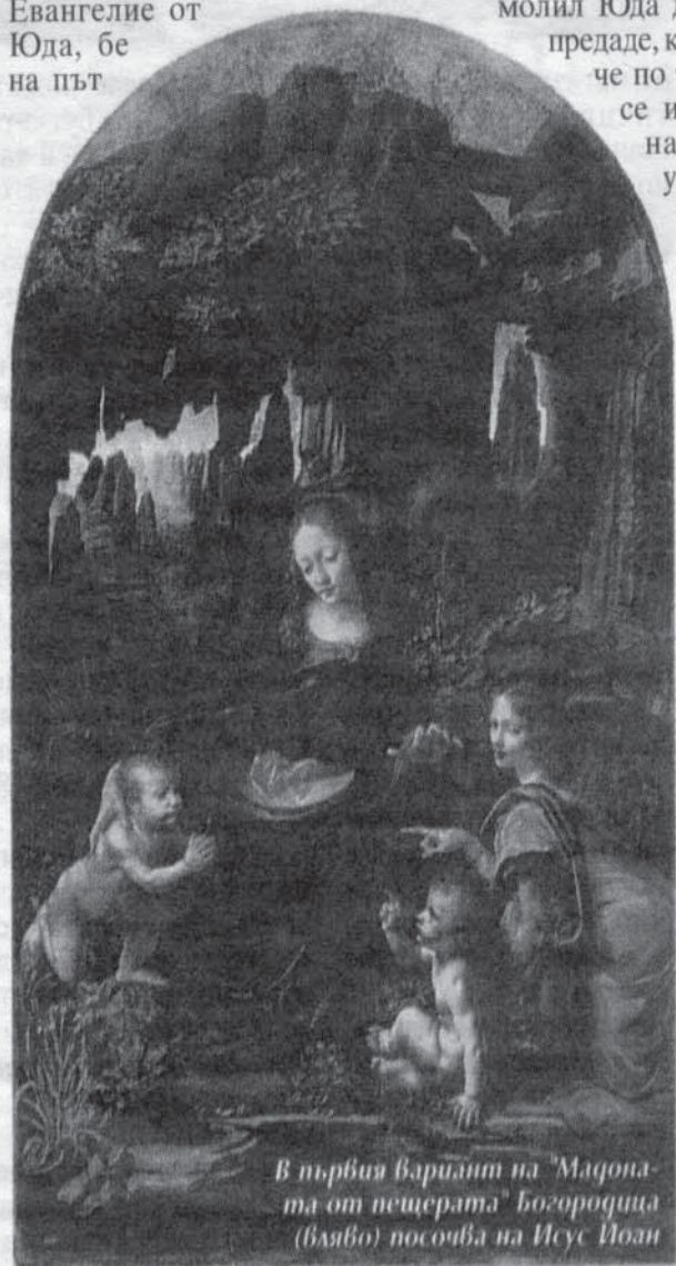
В първия вариант на "Мадоната от пещерата" Богородица (вляво) посочва на Исус Йоан

През 2006 г. след дълга реставрация официално публикуван апокрифен християнски ръкопис, който включва единствения известен текст на т.нар. Евангелие от Юда, бе на път