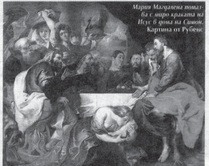
Мария Магдалена помазва с миро краката на Исус в дома на Симон. Картина от Рубенс

Защо хората биха измислили съперничеството между свети Петър и Мария Магдалена? Дан Браун смята, че и Мария Магдалена може би е била сред създателите на християнството. И наистина да е била избраният последовател на Исус, който да бъде "Апостолът на апостолите", а не Петър и Павел.