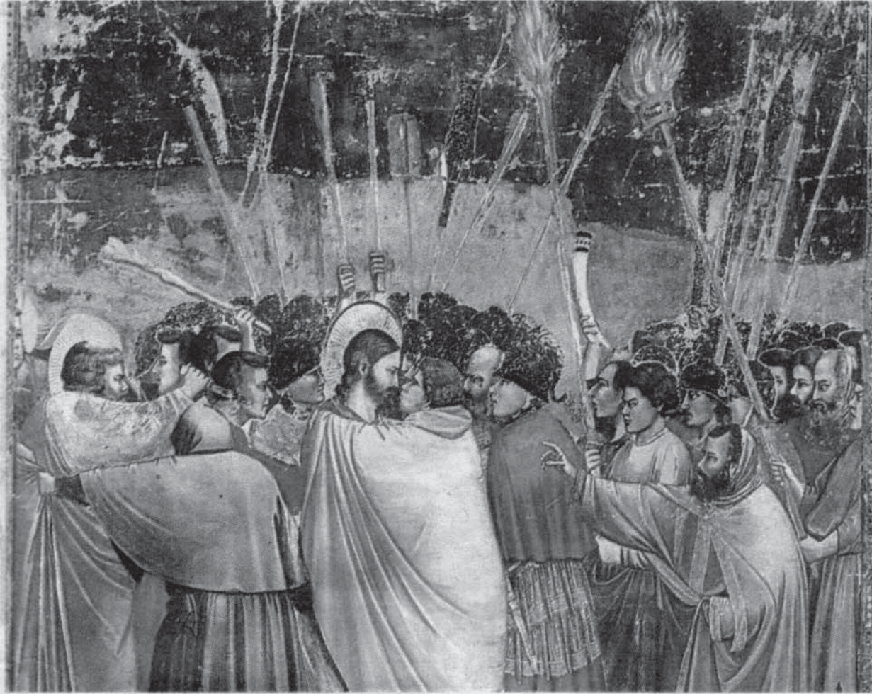
Целувката на Юда. Картина от Джото