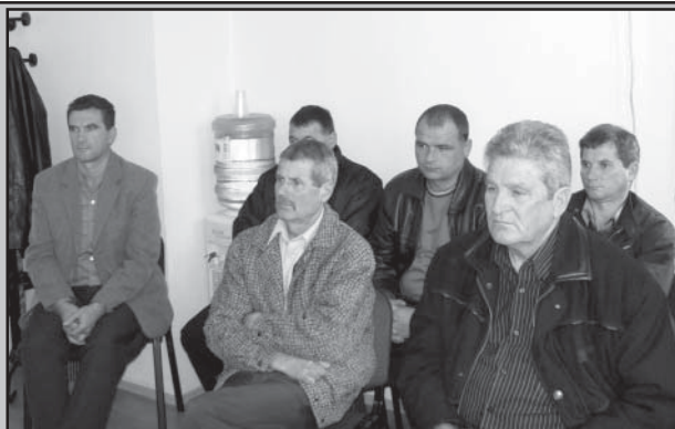
Малкото кметове, които присъстваха на провело се на 28.11.2008г. заседание на Общински съвет - Струмяни. (Взети решения в сл.брой)