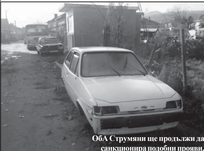
ОбА Струмяни ще продължи да санкционира подобни прояви.