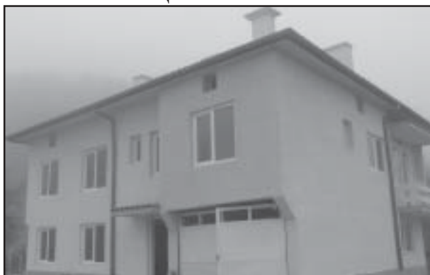
Защитеното жилище в село Раздол Още по темата на стр.3

Със заповед на Изпълнителният директор на Агенцията за социално подпомагане към МТСП в с.Раздол ще бъде открито Защитено жилище. Защитените жилища са вид социална услуга, предоставяна в общността и осигуряваща условия и среда, близка до семейната и позволяваща им да водят по-добър начин на живот с помощта на специалисти.