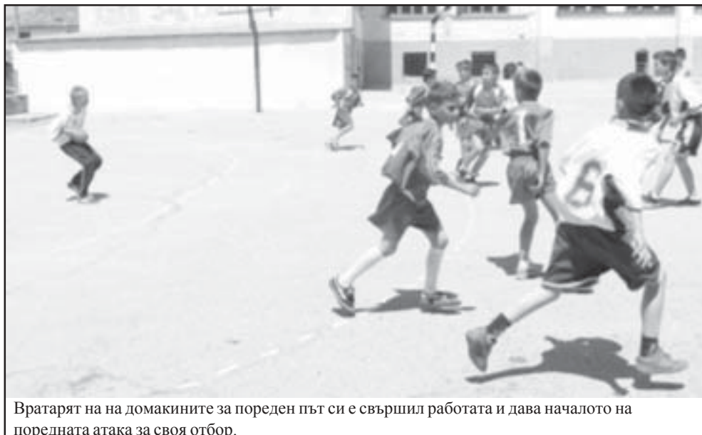
Вратарят на домакините за пореден път си е свършил работата и дава началото на поредната атака за своя отбор.

Пореденият кръг от първенството по хандбал, зона „Витоша“ за деца до 12 години, се състоя в село Илинденци на 13.05.2007 година.