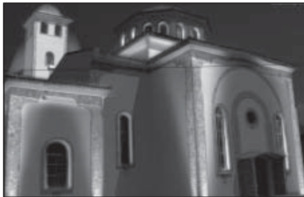
Изглед на черквата „Св.св.Константин и Елена“, с.Струмьяни

Изграждането на православен храм „Св.св. Константин и Елена“ започва на 22 март 1992г., когато се полага основния камък от Негово високопреосвещенство блаженопочиналият Св. Неврокопски митрополит