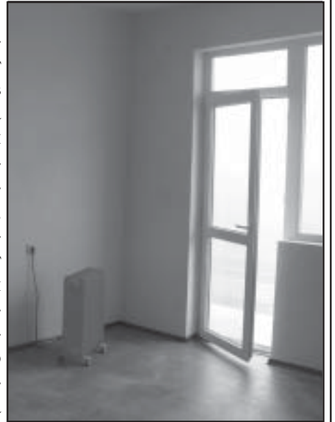
Стаите в жилището са изцяло обновени

Лицата, които ще бъдат настанени в жилището, са хора с лека и умерена умствена изостаналост, прекарвали по-голяма част от живота си в специализирани институции, но имащи реален шанс за социална интеграция.