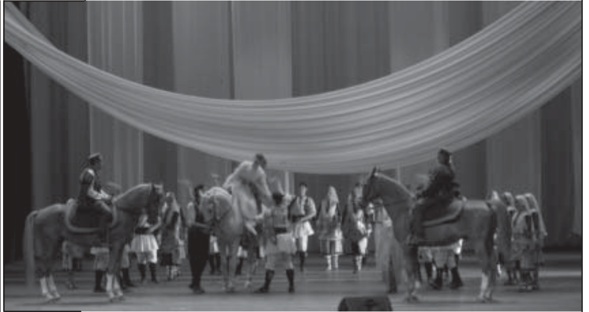
Хора и животни се вплетоха в сценичната магия на спектакъла „Албена“

На 20 май в секи гражданин има възможността да реши кой да представлява България пред Европа. Направете сами своя избор! Гласувайте!