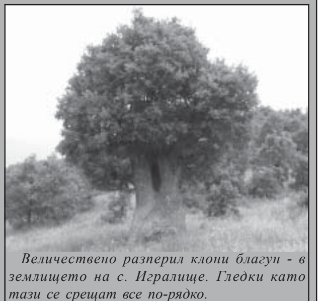
Величествено разперил клони благуна - в землището на с. Игралище. Гледки като тази се срещат все по-рядко.

Горите в България са 3,9 млн.хектара или 34% от територията на страната. 55% от тях са млади, на възраст до 40г., а само 9% са на повече от 100 години. Българските гори са част от световното природно наследство. Да ги опазим!Декар широколистна гора отделя годишно 256 кг. кислород, а иглолистната – 162 кг. Декар дъбова гора, при подходящи условия изпарява годишно 4100 литра вода в атмосферата. Декар букова гора чрез листата, клоните