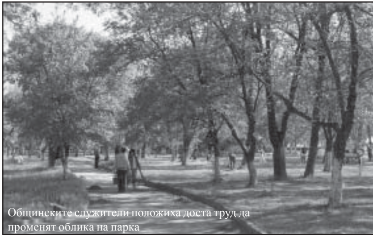
Общинските служители положиха доста труд да променят облика на парка

и детски кът, а в началото на следващия месец ще бъде оформено спортно игрище за малчуганите не само от Микрево, но и от Струмьяни.