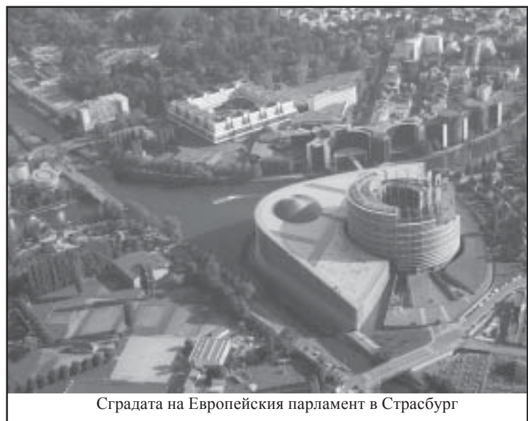
Сградата на Европейския парламент в Страсбург

В следващия брой очаквайте: Как се избира евродепутата и какви са неговите функции..