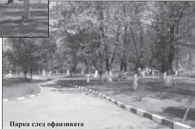
Парка след офанзивата

100 дървета и храсти и варосани половината от дървета. До края на следващата седмица по проект, финансиран от МОСВ, в парка освен монтираните вече пейки ще бъдат поставени кошчета