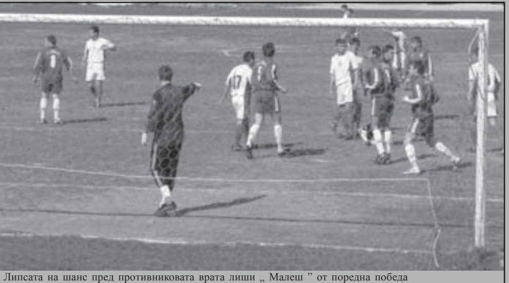
Липсата на шанс пред противниковата врата лиши „Малеш” от поредна победа