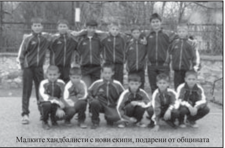
Малките хандбалисти с нови екипи, подарени от общината

Младите хандбалисти от село Илинденци през по-голямата част от срещата бяха догонвачи в резултата, но с много хъс и желание успяха да достигнат до равенството в края на мача.