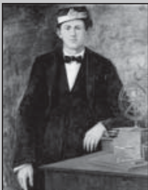
Тодор Каблешков - български революционер и един от ръководителите на Априлското въстание. Автор е на прочутото Кърваво писмо.

Подписано символично с кръвта на едно от убитите заповестници, то става известно известно известност като "Кървавото писмо". Веднага след получаването на пис-