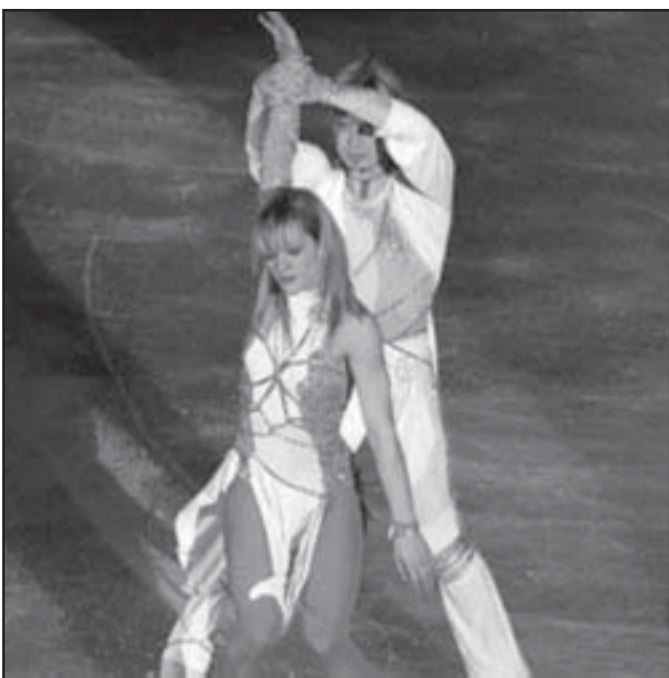
Албена и Максим бяха с класа над всички.

Албена Денкова и Максим Стависки постигнаха поредния голям успех в своята кариера, след като спечелиха за втори път световната титла при танцовите двойки. Българската двойка триумфира със златните медали на първенството на планетата по фигурно пързаляне в Токио (Япония), след като запази лидерската си позиция и след волната програма. Те изпълниха божествено своето съчетание, под звуците на адаптация на