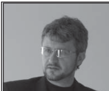
Валентин Чиликов – кмет на община Струмьяни