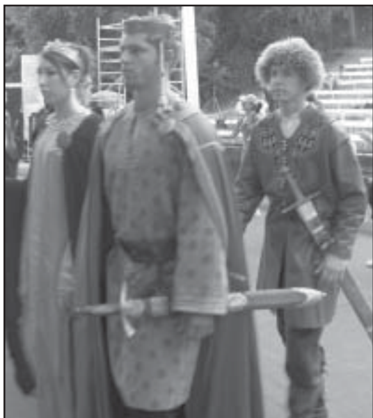
Последна репетиция през деня – при 45 градуса на сянка