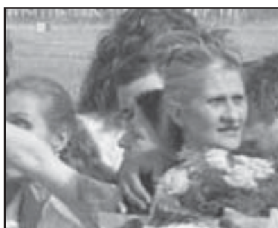
Сълзи на радост и дългоочаквани прегръдки на летище София

След намесата на френския президент - Никола Саркози, българските medici пристигнаха в София с президентския самолет на Френската