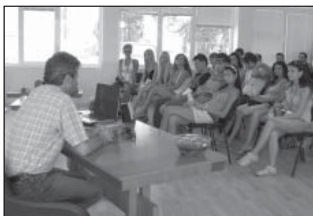
Моделите бяха посрещнати от кмета на общината в голямата зала на читалище „Будител”, с.Струмьяни

модели – момчета и момичета, с доказани качества в професията и ще определи победителите, които ще пред-