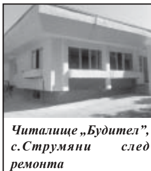
Читалище „Будител“, с.Струмьяни след ремонта

С осигурените средства читалище „Будител“ подмени дограмата в библиотеката , а до края на месец август и другите две читалища ще оползотворят най-целесъобразно парите.