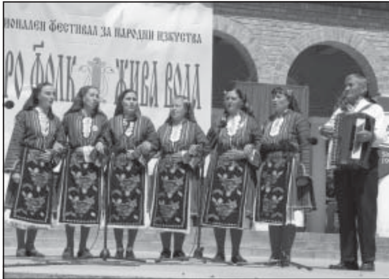
◀ Самодейците към Фолклорен Ансамбъл „Малешевци“, при читалище „Братя Миладинови“, с.Микрево

тие“ и „Лауреат“. Ансамбъл „Струма“ получи и Диплом за съществен принос при съхранение и развитие на българските традиционни народни изкуства, а „Малешевци“ - Препоръка за излъчване по публичните и обществените медии. Дискове с избрана родопска народна музика, получиха и двата наши състава.