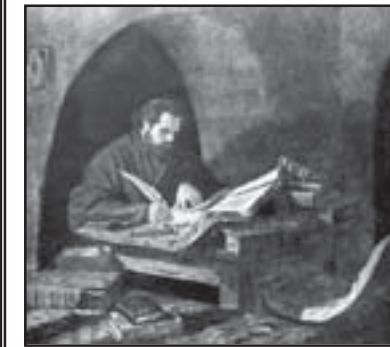
Подписът на св. Паисий Хилендарски

Сведенията за живота му се изчерпват със съобщението от него в единствената му творба "История славено-болгарская". Роден е в Самоковска епархия, най-вероятно в Банско. Не е учил "нито граматика, нито светски науки". През 1745 отива в Хилендарския манастир, където по-късно е йеромонах и