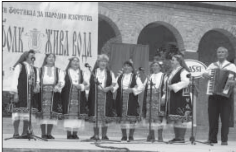
Изпълненията и на двата наши състава съдържиха художествена стойност на текстовете и въздействащ заряд, което заслужава да се види и покаже.