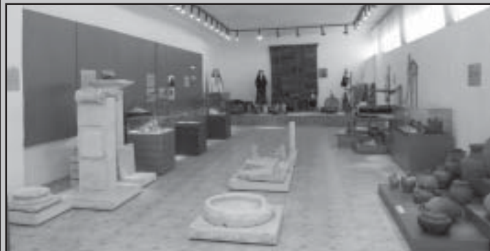
Музейна сбирка „Струмьяни”

Община Струмьяни реализира проект „Дигитализация – мост към миналото и живата традиция”, финансиран от Министерство на културата. Целта му е съхраняване и популяризиране на богатото културно-историческо наследство на общината. Със средствата по проекта бяха заснети най-интересните експонати