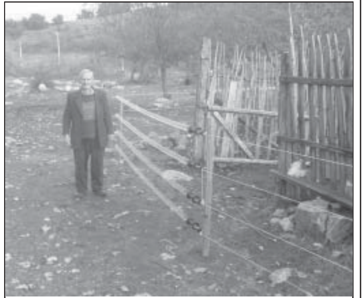
Жител на с.Каменица, общ.Струмияни стои до оградената с „електопастир“ кошара.

Във вторник и сряда около кошарите на селата Каменица, Горна Крушица и Илинденци започна монтирането на първите електропастири. Предстои поставянето на още 15 електропастира в села, не само в община Струмияни, но и в общините партньори по проекта-Сандански, Симитли, Кресна и Петрич. За територията на Национален парк „Пирин“, който е асоцииран партньор по проекта, поради сезонния характер на пашуване на добитъка е предвидено поставянето на подвижен електропастир, който община Струмияни, след заявено желание от страна на животновъдите, ще отдава за ползване всяка година, след което-през зимата, съоръжението ще се връща и съхранява в общината до следващата година.Поставянето на електропастири около кошарите е една