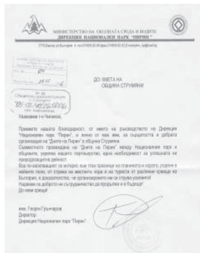
Благодарствено писмо от Директора на Дирекция Национален парк "Пирин" до кмета на общината

ще бъде финансирано закупуването на технологично оборудване (вкл. лицензи, патентни права, софтуер и т.н.), което има пряко отношение към производствения процес на съответното предприятие. Компонент «Професионално обучение» - финансиране на обучение на персонала на предприятието - кандидат, пряко свързано с предоставените консултантски услуги и/или получената инвестиционна подкрепа. Обучаващата организация трябва да бъде лицензирана от Националната агенция за професионално образование и обучение.