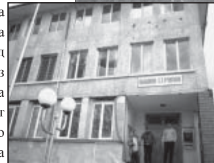
Сградата на общината преди ремонта (2004 г.)

сздаде необходимостта от основна реконструкция около площада /озеленяване и зацветяване/.