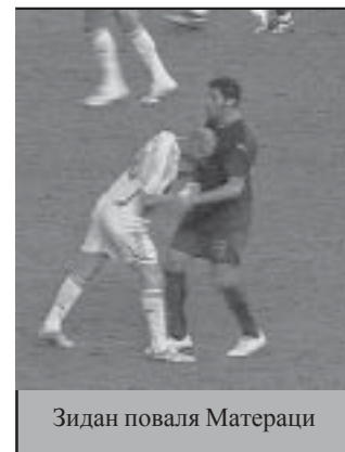
Зидан поваля Матераци

след точно изпълнение на 11 метров наказателен удар. В 19-та минута Марко Матераци скочи високо в полето на Бартез и след удар с глава изравни резултата, който не се промени до края на п р о д ъ л ж е н и я т а . Големият виновник за Франция тази вечер бе