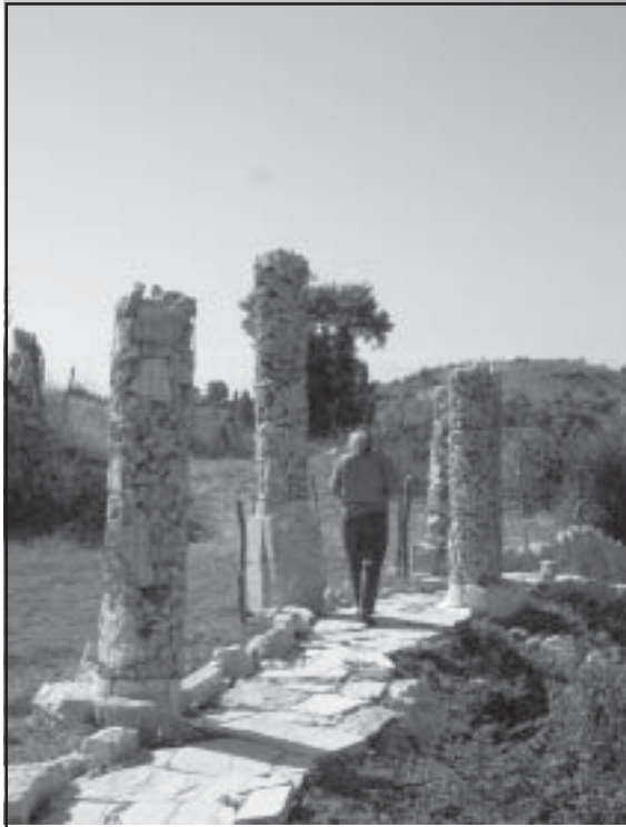
скулптури от Арт Център Илинденци

Заповядайте на 21 юли 2006 г. /петък/ в Арт Център Илинденци, на един от традиционните "Дни на Пирин 2006", концерт на местни изпълнители. Програмата ще бъде съпроводена през целия ден от открит базар,