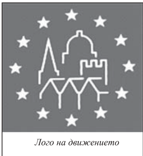
Лого на движението

жанието и формите на дните. От 1999г. България се включи