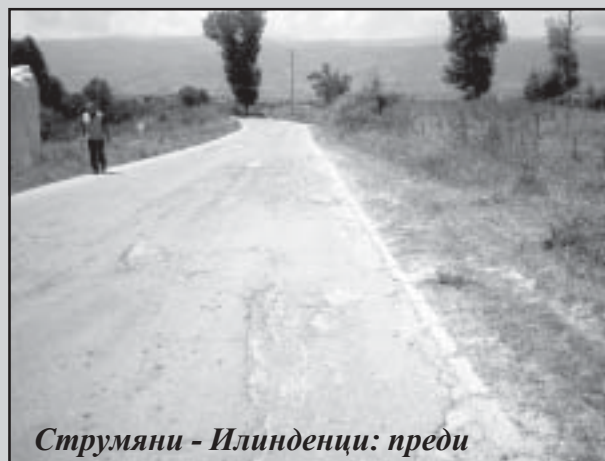
Струмiani - Илинденци: преди

В брой 8 на вестник „Струмiani”, Ви информирахме, че „от 24.07.2006г. започна изкърпването на пътя Студената вода – Добри лаки, след което предстои и поетапното асфалтиране на пътя Струмiani – Илинденци.” Тези дейности вече са факт. Осемстотин квадратни метри от пътя Студената вода – Добри лаки бяха закърпени с