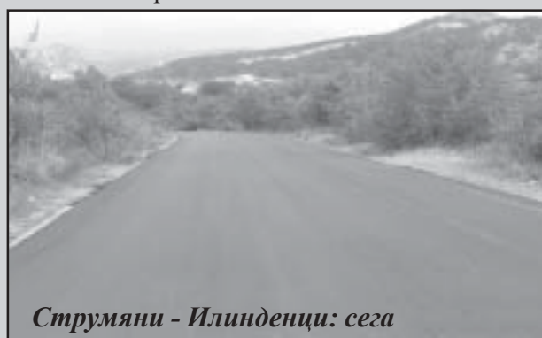
Струмiani - Илинденци: сега

асфалт, а 400 метра от пътя Струмiani – Илинденци бе асфалтиран. Финансирането за двата обекта, които са част от списък за необходимите ремонти по пътища от общинската пътна мрежа бе получено целево от Изпълнителна агенция „Пътища”.