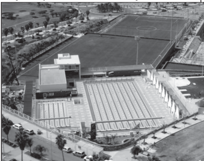
Изграденият, с взаимните усилия на община и местен бизнес спортен център "Tenerife top training".

зимни условия, докато в топлата Испания не бе така. И може би точно в това е проблема - всеки от нас е специалист и индивидуалист. Не сме екип, което явно ни пречи да се развиваме. Запознавайки се отблизо с условията на работа в Община Адехе, спокойно може да имаме самочувствието, че в Община Струмьяни, на база оборудване и изисквания към служителите, сме на едно завидно европейско ниво. Прави впечатление обаче силната им връзка с миналото и историята, вплели в едно историческото с модерното."