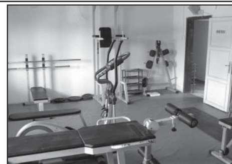
Спортната база в Микрево отговаря на всички критерии.