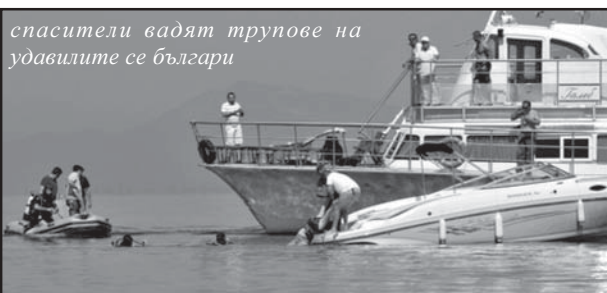
спасители вадят трупове на удавилите се българи