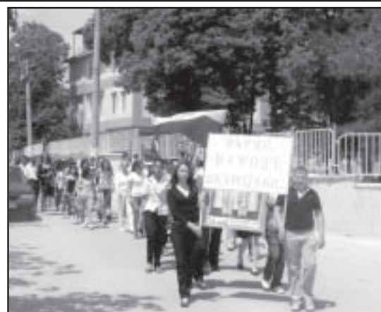
Част от честванията в Микрево