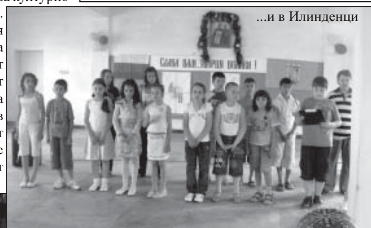
...и в Илинденци