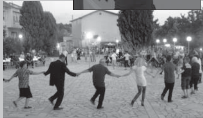
Нестинарските танци се превърнаха в традиция в Струмияни. Мало и голямо дойде на центъра в Струмияни, за да зърне танца върху горещата жаравя.