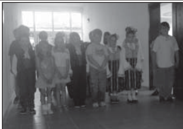
В салона на училището в Струмияни