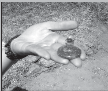
Очаквайте подробности в сл.брой