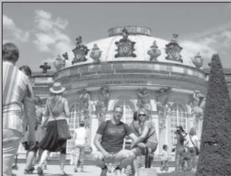
Дворецът San Souci.