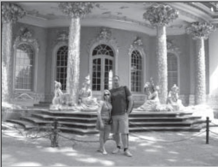
Пред двореца San Souci.