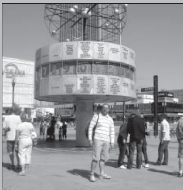
Часовникът на Александър плац, който показва часовото време навсякъде по света.