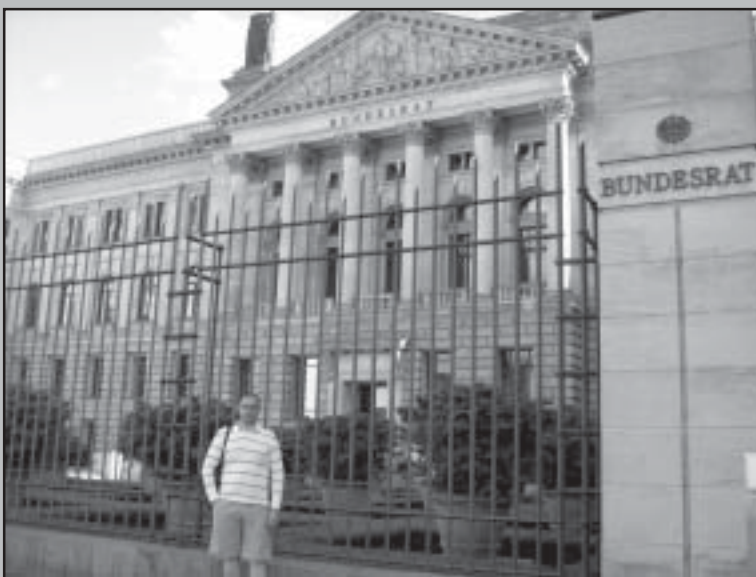
Бундесрат - висш законодателен орган.