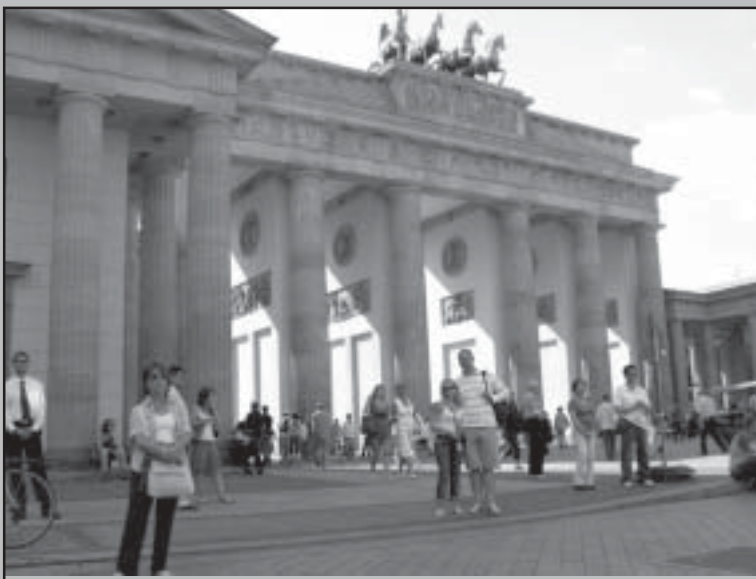
Бранденбургската врата - тук за първи път е отворена Берлинската стена.