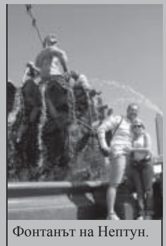
Фонтанът на Нептун.