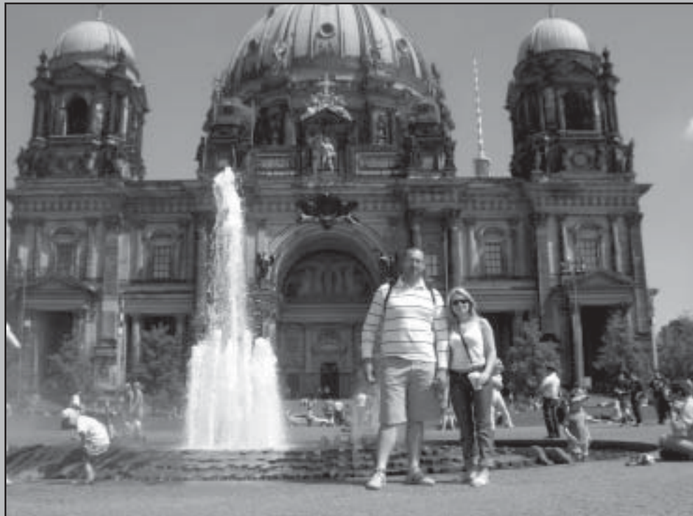
Берлина дом - най-голямата църква в Берлин