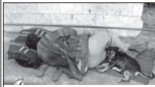
И през 2008 година гледки като тази все още се срещат.

Около 67% от домакинствата в България имат пари, колкото да свържат двата края, според изследване на Националния статистически институт. През април е регистрирано задълбочаване на песимизма, по отношение на основни икономически процеси и явления, в сравнение с времето три месеца по-рано. Че затъват в дългове, заявяват 16.3% от домакинствата, а 5.6% са принудени да теглят от спестяванията си. 7.3% посочват, че успяват да спестят малко пари, а едва 0.1% отговарят, че спестяват много. Финансовото състояние на 36.5% от домакинствата не се е променило за последната година, на 28% малко се е влошило, а на 25.8% се е влошило много. Състоянието на едва 7.7% от домакинствата се е подобрило, в сравнение със ситуацията преди 12 месеца. Само 6.7% от домакинствата очакват през следващата една година просперитет на състоянието им, а 19.9% са отрицателно настроени. Според 77.6% от гражданите цените са се повишили твърде много и очакванията са да растат още по-бързо. За 67.5% е невероятно, през следващата година, да спестят пари. За 75.7% е невъзможно да си купят кола през следващите 12 месеца. Близко 65% признават, че няма да успеят да отделят голяма сума пари за подобрения в домовете си.