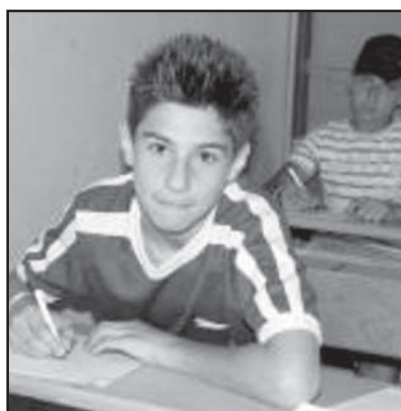
Седмоласниците могат да проверят резултатите си в интернет.

Оценките от изпитите по български език и литература и по математика за кандидатстване след 7 клас вече са качени на адрес http://7klas.mon.bg .