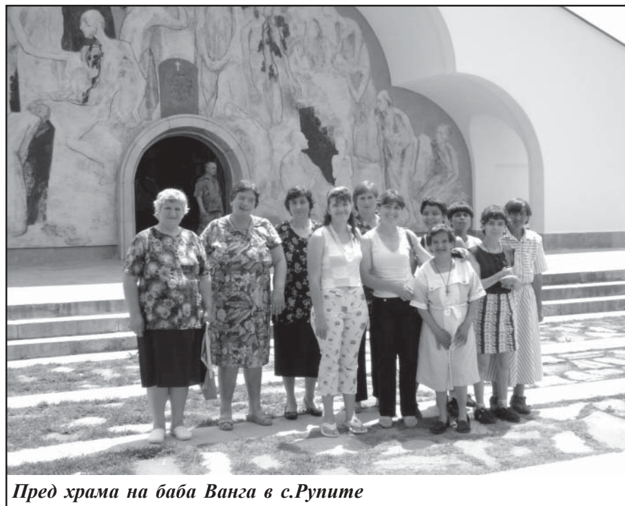
Пред храма на баба Ванга в с.Рупите

На 26 юни (четвъртък), потребителите от Защитеното жилище в село Раздол се тръгнаха на едnodневна екскурзия до с.Рупите, Роженския манастир и гр. Мелник.