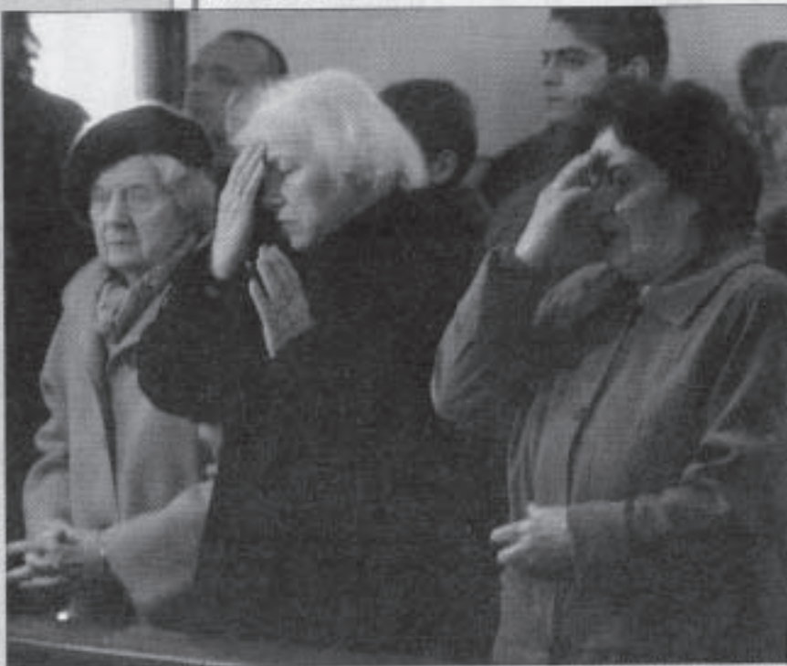
Жени се кръстят по време на литургия.

Когато се осеняваме с кръстното знамение, трябва да помним, че е нужно да изобразяваме кръста правилно и без да бързаме, иначе това не ще бъде изобразяване на кръста, а просто махане с ръце, на което само бесовете се радват. С небрежното извършване на кръстното знамение ние оскърбяваме Бога - показваме своята непочителност към него - грешим. Този грях се нарича кощунство. Гръхът е нарушение на божията воля, която ни е открита в неговите свети заповеди.