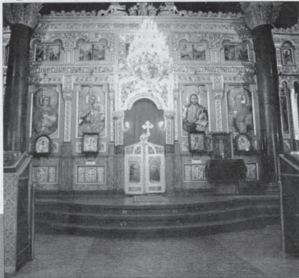
Олтара на църквата "Света Неделя"

Наръчникът на християнина се разпространява със съдействието и благословието на Ловчанската митрополия.