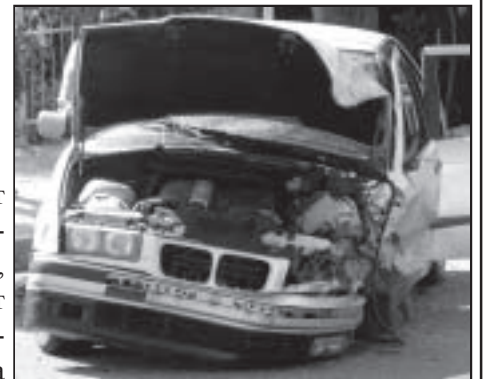
Катастрофа в с. Струмяни, ул. "Международно шосе", 2007 год.

(Пренос от стр.1)превишават скоростта, управляват МПС под въздействието на алкохол, не ползват обезо-