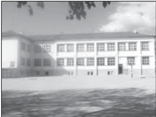
Основно училище "Св.св.Кирил и Методий", Илинденци.