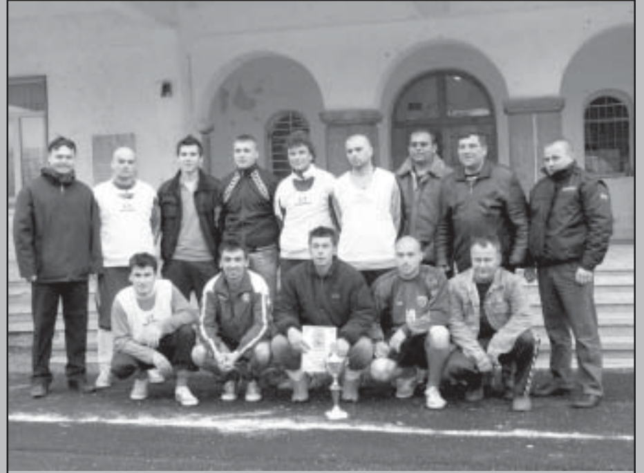
Шефове и служители от 3S COT заслужено застанаха зад спечелената купа на пролетния турнир по футбол.

За втора поредна година отборът на 3S COT спечели купата на кмета на община Струмьяни в ежегодния пролетен турнир по футбол. Купата е преходна и само при три победи остава завинаги при отбора - победител.