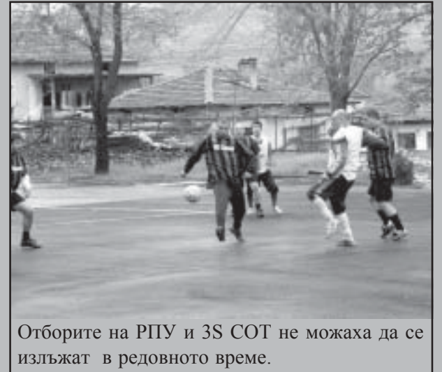
Отборите на РПУ и 3S COT не можаха да се излъжат в редовното време.

В неделния дъждовен ден отборите на 3S COT и РПУ направиха мъжки финал на игрището при училището в Микрево.