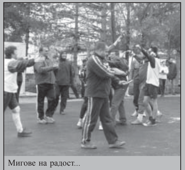
Мигове на радост...

Трябва да се отчете и достойният дебют на РПУ, който с лекота стигна до крайната фаза на турнира и даде заявка за догодина.