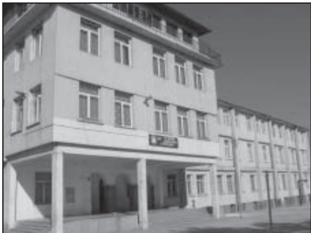
Средно общообразователно училище "Св.Паисий Хилендарски", Микрево.

Във връзка с един от най-наболелите проблеми, не само в община Струмяни, но и в цяла България - повсеместно закриване на училища в резултат на оптимизиране на училищната мрежа и въвеждане системата за делегираните бюджети, приета от Министерството на образованието, на 8 и 9 април бяха проведени срещи между родителите на деца в селата Струмяни и Илинденци и общинското ръководство.