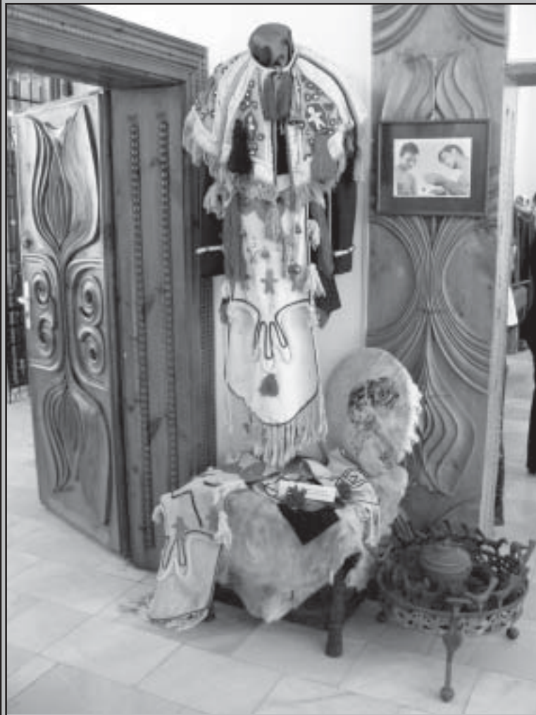
Костюм на шаман от филма “Хан Аспарух”