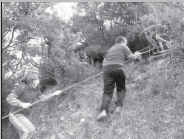
За разлика от останалите деца от Микрево се изстреляха по въжето към Горно Градище.