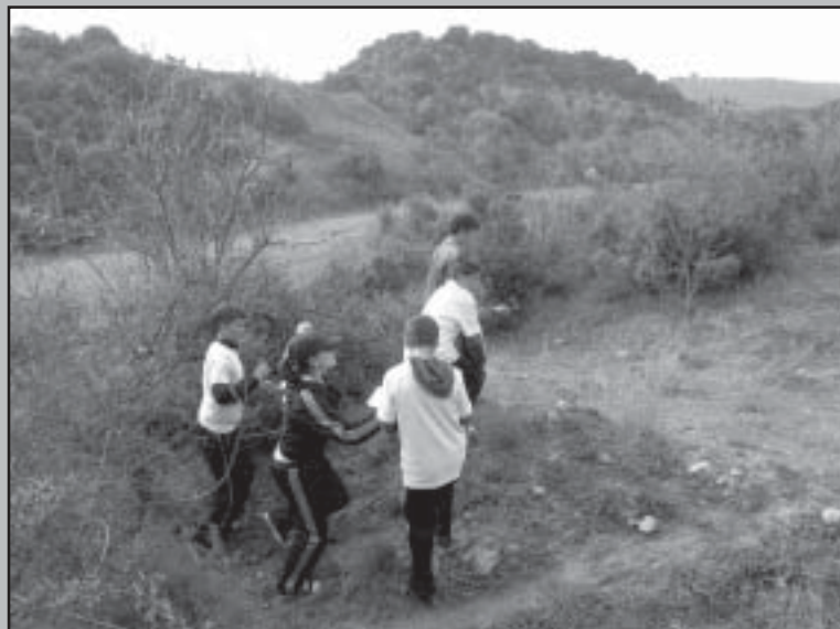
Отборът на Струмяни потегли пръв в търсене на свитъка.