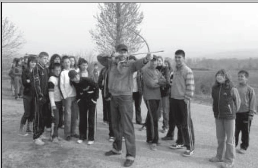
С първата стрела, кметът на общината даде старт на състезанието.

В уникално по рода си състезание взеха участие деца от Микрево, Струмяни и Илинденци, които трябваше да покажат бързина и съобразителност по екопътеките около село Микрево и в местността “Градището”, в търсене на скрит свитък. Всеки от отборите излъчи по един представител, който да стреля с лък. Първи по маршрута тръгна племето кимери(децата от Струмяни), след тях бяха стримоните (Илинденци) а последни - медите(Микрево), които бяха и в най-изгодна позиция. С бързина и съобразителност победители станаха “медите” от Микрево.