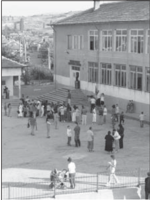
Основно училище "Св.св.Кирил и Методий", Струмяни.