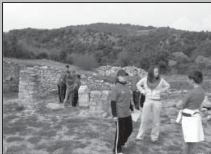
Снимката е показателна - докато отборът от Илинденци все още търси свитъка на своето племе, на заден план отборът от Микрево вече чете написаното на техния свитък.