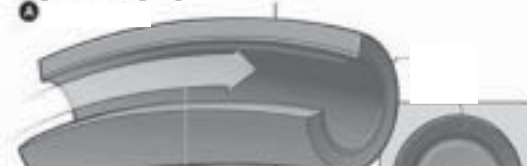
нормален кръвен поток