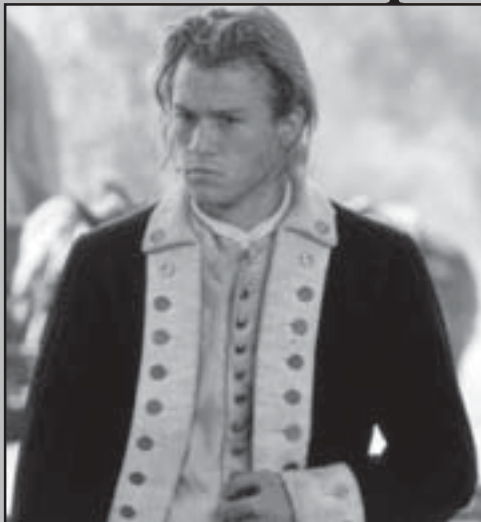
Хийт Леджър в "Патриотът"

Актьорът Хийт Леджър бе намерен мъртъв в апартамента му в Манхатън. Полицията разследва вероятността актьорът да е починал от свръхдоза приспивателни таблетки и не изключва вероятността за самоубийство. Изигра главните роли в "10 неща, които мразя в теб", "Братя Грим", "Казанова", "Патриотът", "Като рицарите" и др.