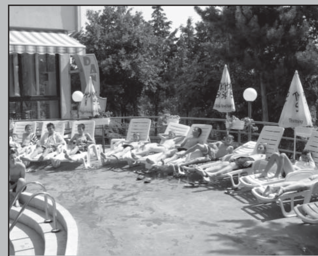
Заслужена почивка след изиграните срещи

6 – ТО МЯСТО В БЪЛГАРИЯ ПО ХАНДБАЛ ! БРАВО И ПРОДЪЛЖАВАЙТЕ В СЪЩИЯ ДУХ!