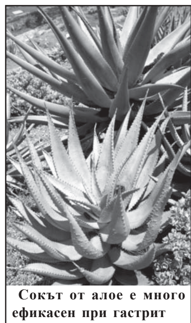
Сокът от алое е много ефикасен при гастрит