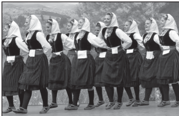
Лъчезарни млади участници във вихъра на фестивала

Да не пропуснем и журито, което се състоеше от 9 члена – специалисти от всички области на фолклорната култура, като за първи път в него бяха включени и международни представители – от Македония и Белгия. Неговата работа беше улеснена и превърната в приятно задължение от безупречната организация, осигурена от домакините – кмета и екипа на общинската администрация. Те достойно и без видимо усилие поеха цялата отговорност за доброто протичане на фестивала: за осигуряването на многобройни спонсори, които по подходящ начин бяха огласявани и рекламирани; за посрещането и успешното представяне на групите; за включването на най-добрите и гостите от чужбина във вечерните концерти; за озвучаването, осветлението