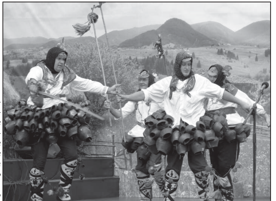
Атрактивната фолклорна група от село Дъбене, Карлово