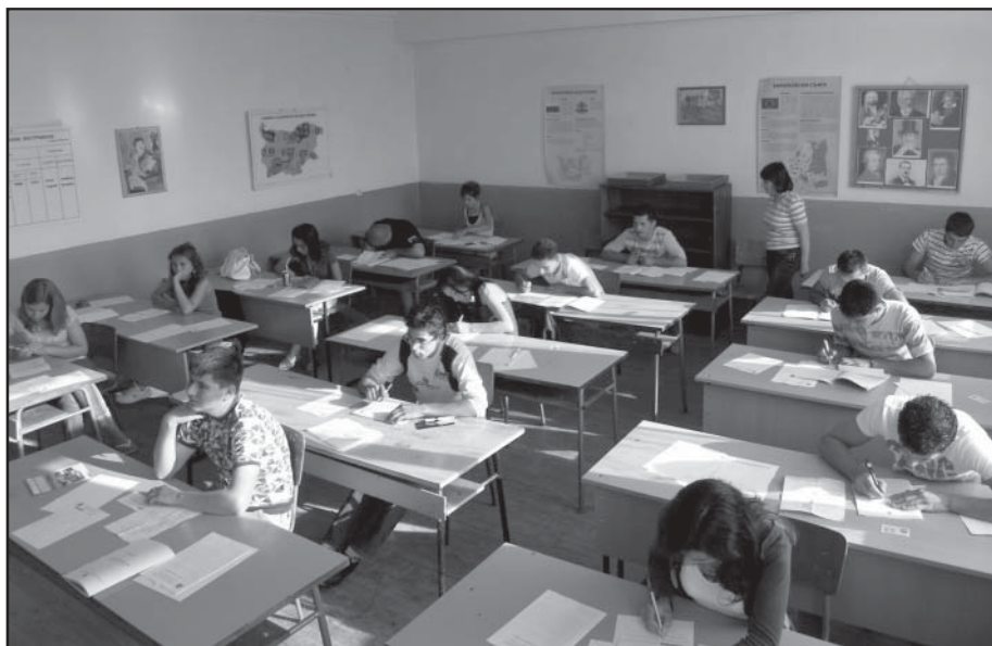
01.06.2008г. - Броени дни след абитуриетския си бал, зрелостниците разсъждаваха върху Йовковия "Шибил".

Всички зрелостници от СОУ „Св.Паисий Хилендарски“, с.Микрево се явиха на първата от десетилетия насам задължителна матура по български език и литература, провел се на 1 юни.