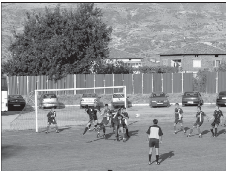
На стадиона в с.Микрево футболистите на "Малеш" така и не можа да отбележат победно попадение във вратата на гостите от Банско.