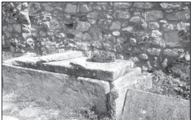
Мястото, където са открити останките на Самуил.