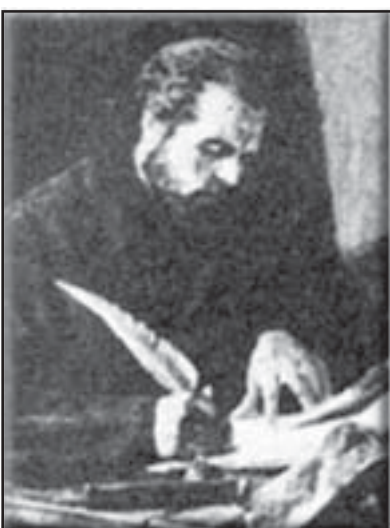
Св. Паисий Хилендарски български народен будител

Днес денят на народните будители се отбелязва като един от големите български празници, с който се припомня за делото на всички онези българи, допринесли за освобождението ни, за духовното и материално процъфтяване на нашия народ.