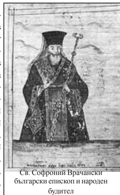
Св. Софроний Врачански български епископ и народен будител

духовния гръбнак на българския народ в трудни години от неговото съществуване и в периоди на подем. Припомняме си имената на св. Иван Рилски, Паисий Хилендарски, Софроний Врачански, Неофит Бозвели, Ботев, Левски, Каравелов,